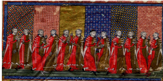
Mairie de Toulouse, Archives municipales, BB273 (détail)