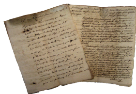
Mairie de Toulouse, Archives municipales, FF828/4, procédure # CA2 DU 10 juin 1784